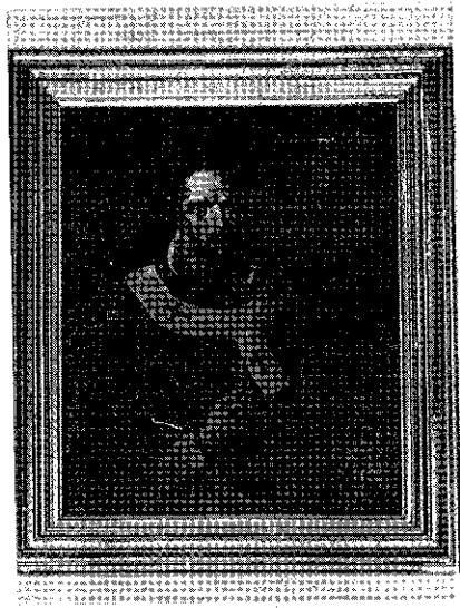
SZÉCHENYI GYÖRGY, a konviktus alapítója